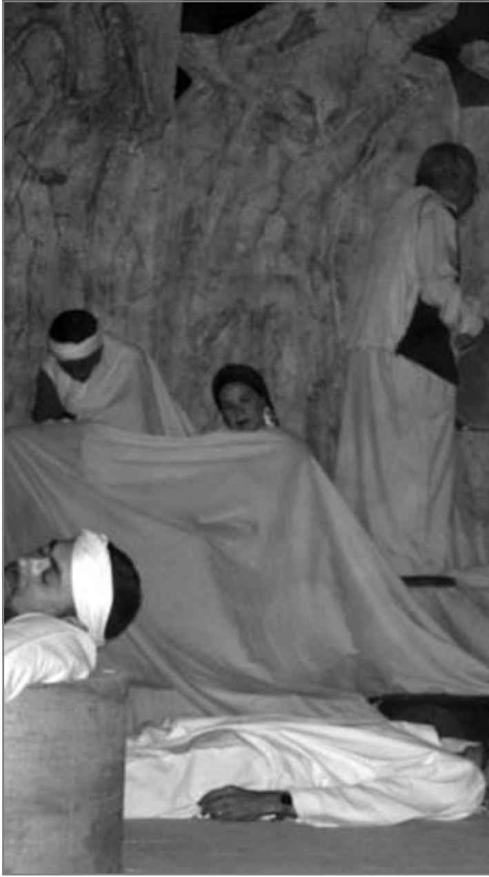
حالة مسرحية شديدة الخصوصية

ديكور يدرك جيداً كنه التشكيل فى الفراغ وخطئة إضاءة محكمة