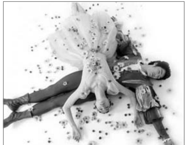
روميو وجولييت .. التشكيل بالجسد