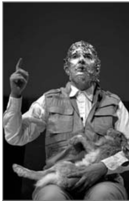
جوزيف بويز في أحد عروضه

السعي الحثيث وراء القبض على المعانٍ، إنما هو تعبير ذاتي فاضح عن رفض داخلي للخواء والفساد.