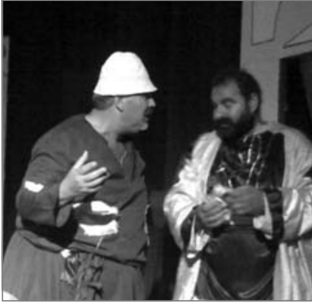
ماذا لو مات الملك هذا هو التساؤل

رغم فقر الإنتاج فقد تعامل الممثلون مع التجربة بسهولة