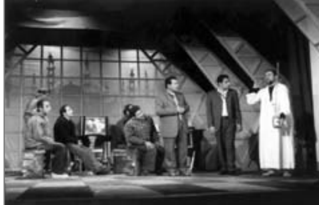
مشهد من عرض "الشفرة"

ما هو موقع الأيديولوجية في المشهد المسرحي المعاصر، هل تحرر مسرحنا المصري من الأيديولوجية، هل خرج مسرح الدولة عن دائرة العروض الموجهة، وماذا عن المسارح الدينية التي ظهرت مؤخراً كالسرح الإسلامي والمسرح الكنسي بما تمثله من أيديولوجية دينية ليست محل خلاف وهل كان ظهورها مرتبطاً بتراجع الأيديولوجيات السياسية ومن ثم فقد ظهرت كأيديولوجيات بديلة تسعى لفرض نفسها باعتبارها وحياً سماوياً لا يخطيء. يحمل للناس الحلول السحرية لعلاج كافة مشاكلهم.