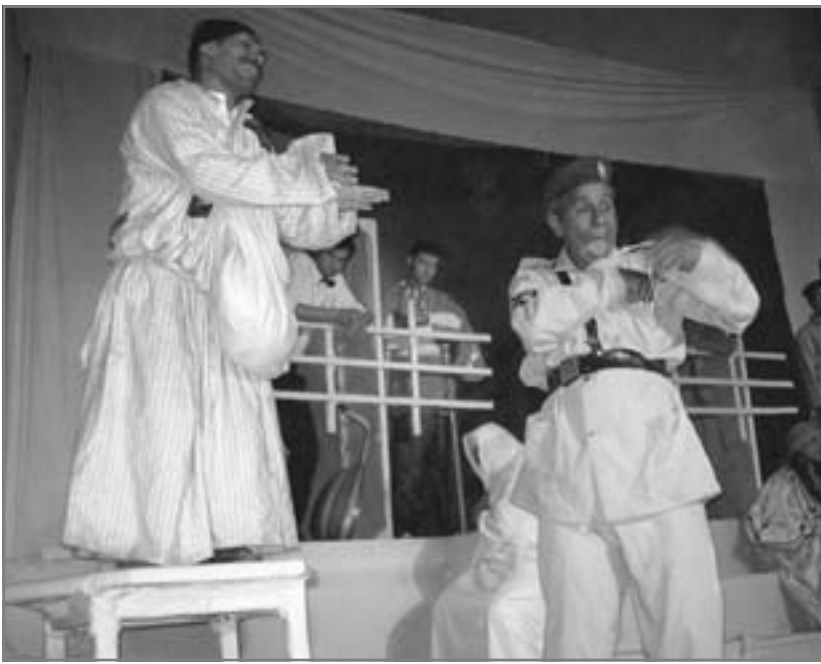
الأغاني أعطت للمسرحية روح الأوبريت الشعبي