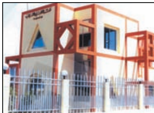
بيت ثقافة بنى عبيد صرح ثقافي جديد