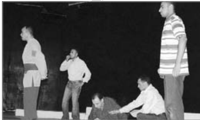
الفنانون كثيراً ما دمجوا لجنة التحكيم في عروضهم

عجزت - لما بين أعضائها والمخرج من مشكلات لسلطوته عليها، ونفوذه البالغ على ما يقدمونه - عن تقديم عرضها أمام لجنة التحكيم، مما يضع الفرقة في حرج ومأزق يتعين الخروج منه. وفي هذا السياق الذي بلغ من الطول في الصياغة مبلغه من الحيرة والتردد المتكرر في الحركة بين مقدمة الصالة والمنصة، يتقدم عمال البوفيه لإنقاذ الموقف والأرتجال على طريقتهم، بالحضر في أحداث السيرة الهلالية، والاختيار من بين حلقاتها العديدة ما يعد غلالة شفافة عن الواقع المعاش، تحتويه وتعبّر عنه في ضوء رؤية محددة له، ومن هنا يطل المستوى الثاني في البنية بوصفه الحكمة الداخلية، ولا شك أن "الحمزواي" أحسن اختيار هذه الحلقة وتطوير معالجتها بحيث تشف عن العلاقات العربية المتقاطعة والمتداخلة إلى درجة التعقيد