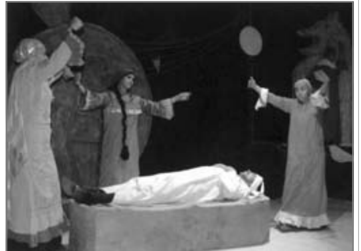
تكنيك متميز يعود إلى المسرح الآسيوى القديم