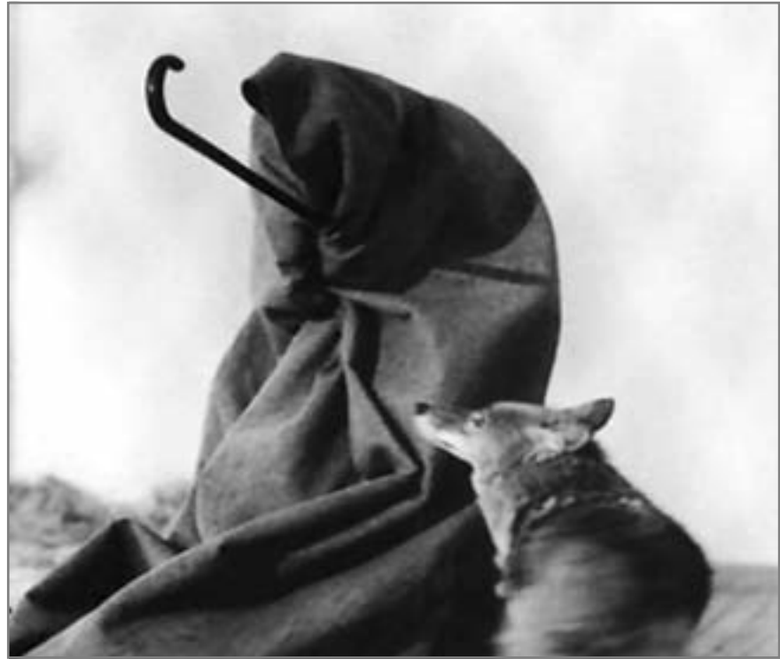
أحب أمريكا وأمريكا تحبني