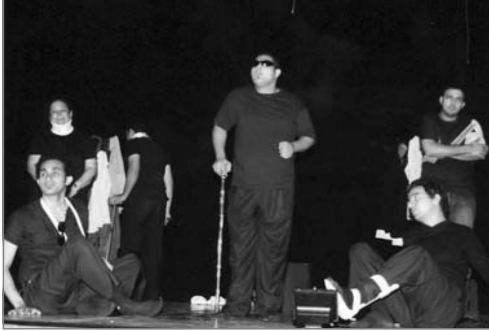
فقدان الأحساس بالأمان أحد معانى العرض

والعلاقات الكاذبة عبر الشات، وإعلانات الحزب الوطنى عن تحرك البلد، وتوهة الناس فى الشوارع وفقدان الإحساس بالأمان أو الأمل كانت جميعها مشاهد متاحة عبر العرض المسرحى. وعادة ما كانت تُعالج مناطق تغيير المظاهر أو التعلق عليها من خلال أغان تراثية قدمها مجموعة الممثلين بأصواتهم التى قد لا تكون قوية ولا مدربة بشكل كاف ولكنها صادقة فى إحساسها ومحبة لهذه الأغاني وهى طريقة تتبعها الفرقة منذ وقت طويل فى عروضها الكثيرة ويعشقها كثير من جمهور الفرقة والبعض منهم يأتى خصيصاً لكى يستمع ويشاهد