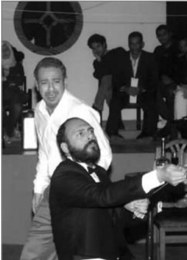
أداء تمثيلى يتسم بدقة الحركة