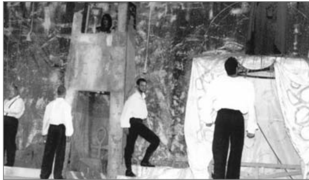
عرض تجريبي يكتسب سحره من غموضه

وسفك الدماء منذ قبايل وهابيل وحكاية الغراب - لذا صاحبت الموسيقى تلك الأجواء والأحداث - دون أن تعلن عن وجودها صراحة - لكنها فى نفس الوقت صبح جزواً لا غنى عنه فى سياق بنية العرض ككل، والذى انتهى بذلك الحديث الودود الدافئ لذلك "الراوي" الإنسان الذى يحلم دائماً، وكان دائماً يحلم فى الماضى بأن يكون شخصاً وكائنات كثيرة لكن "الزمن" هو الذى جعله يقبع أو يتحرك - حتى فيما بين المتفرجين فى النهاية - ليعلم أن "المقتلة البشرية" لم تنته ولن تنتهى أبداً..