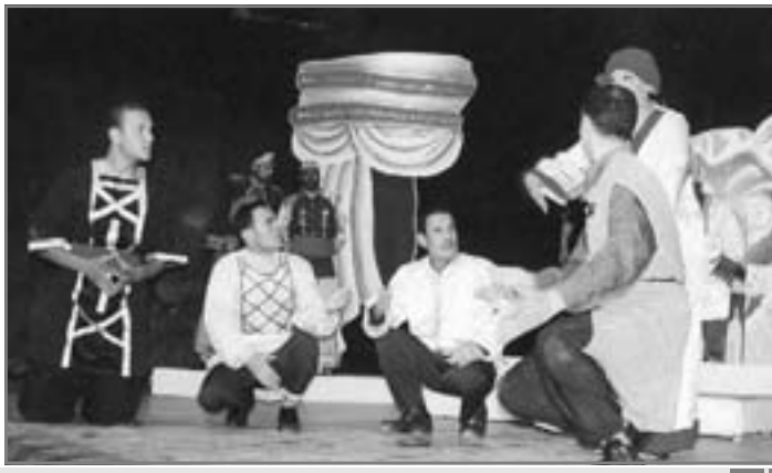
العرض تمزق في لوحات منفصلة

سيل من الشكاوى التي تندر من لجان التحكيم!