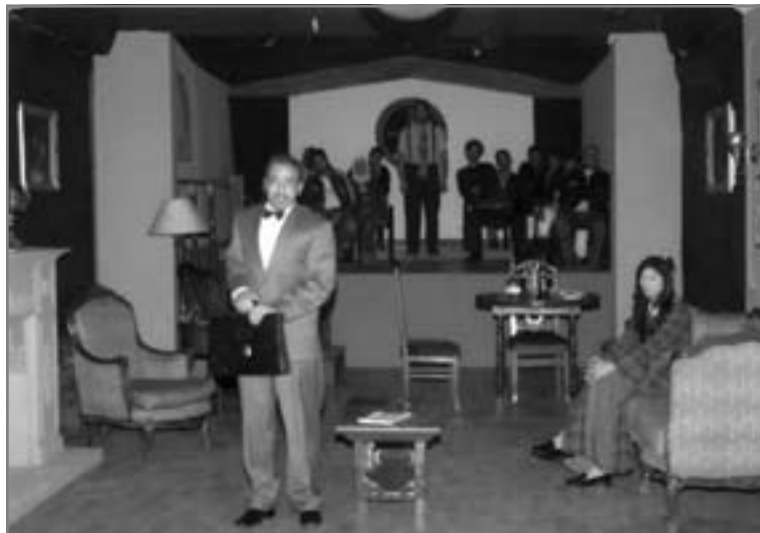
لوحات متتابعة تعرض لهمومنا الاجتماعية

القصة نعرفها منذ اللحظة الأولى عندما يقرأ بيدرمان جريدته، هناك من يدعى أنه بائع جوال ويطلب طعاماً ومأوى ثم فى اليوم التالى يحترق المنزل، وتتكرر الحادثة، وكان بيدرمان يعلن فى الحانة بقوة أن هؤلاء يستحقون أن يعلقوا على أعواد المشانق!.. ولكن قبل الاستطراد ينبغى الإشارة إلى أن النص الأصلي والذى كتبه كاتبه فى البداية كنص إذاعى، هذا النص مكون من لوحات متتابعة، تروى على لسان الكورس