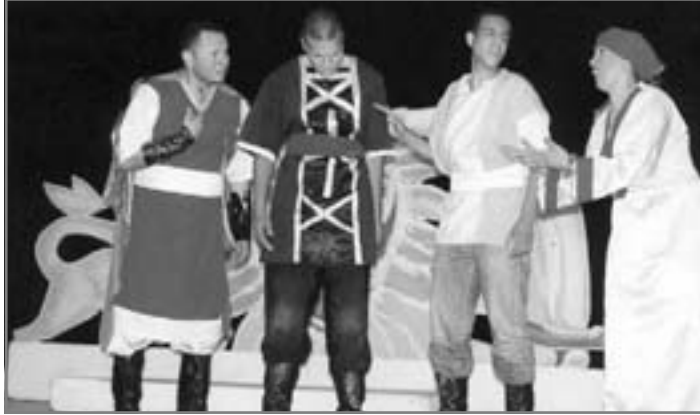
المخرج تعامل مع النص بالقطعة

فقد أبي الملك "زحلان" أن يجير قبائل الهلالية بقيادة الأمير "رزق" في محنة القحط التي تعرضت لها واضطرتها للترحال من أرضهم "نجد"، واعتدت عليها قواته، مما دفعها للزحف على أرضه واحتلالها. ولم يكن "زحلان" يستطيع أن يتصدى لهذا العدوان بعبيده المأجورين فسرعان ما أثر الفرار بأبنائه وما خف حمله وغلا ثمنه من ثروته، ليضعه - في لحظة فارقة - بين يدي ملك "الروم" مقابل جهوده في تحرير أرضه من "رزق" وقبيلته، ولا يلبث ملك "الروم" أن يقود حلفاً يجر إليه قبائل عربية أخرى بإثارة مخاوفها من "رزق" وأطماعه المحتملة، مما ينيخ بهم