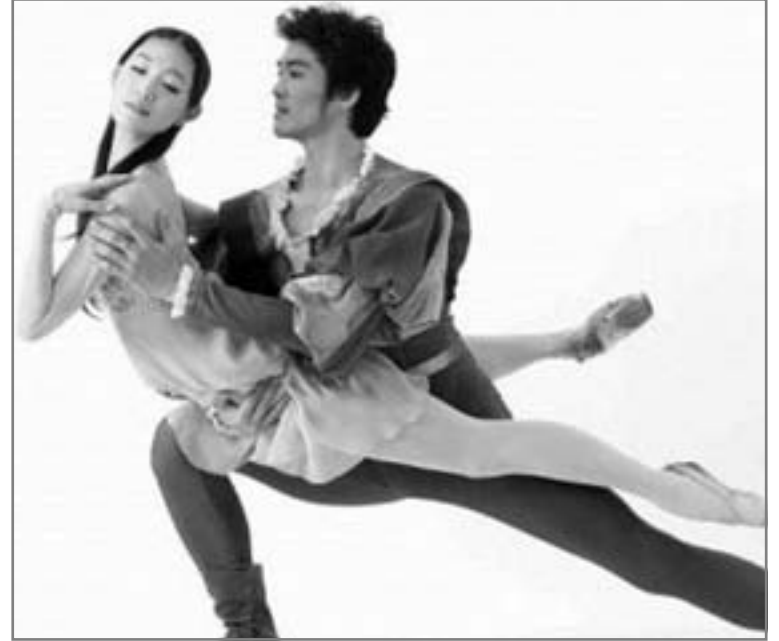
نص إنجليزي بروح شرق أوسطية