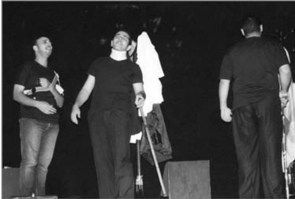
كوميديا سوداء تعرض للبضاعة المضحكة

وعلى نفس الطريقة التى أثبتت فى مائة سنة تنوير (شيل الوطن لفوق - حط الوطن لتحت - ودى الوطنى يمين - هات الوطن شمال) تم كشف حال الوطن رويداً رويداً، فمشاكل التعصب التى تظهر على سطح الأحداث من وقت لآخر وإدمان الشباب، وحادث العبارة