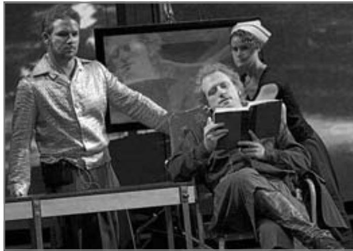
القديم صالح دائماً للمعالجات الجديدة

وبالمثل، وعلى نطاق أوسع، نحن نمضي في الحياة مدركين جزءاً ضئيلاً جداً من كل ما يمر أمام أذهاننا. نحن نعرف من الحياة قدر ما ندرك منها. وباستخدام عبارة أخرى لتوضيح نفس المعنى: نحن لا نعرف من الحياة سوى ما استطعنا أن نتخيله أو نشئ له واقعا منطقياً. والآن نجد أن ما جعلناه بأنفسنا حقيقة - بفعل الخيال - يكون بالنسبة لنا جديداً وفورياً، على الرغم من أنه قد تم إدراكه من قبل ملايين من البشر فيما مضى. إنه جديد لأننا صنعناه، ولأننا مختلفون عن جميع أسلافنا. لقد تخيل لاندور إيطاليا، وأدركها وجعلها حيوية وجديدة. وبمعنى موضوعي، لقد ابتكر "إيطاليا" التي لم يكن لها وجود من قبل. ثم جاء بروننج فيما بعد، بتخيّل